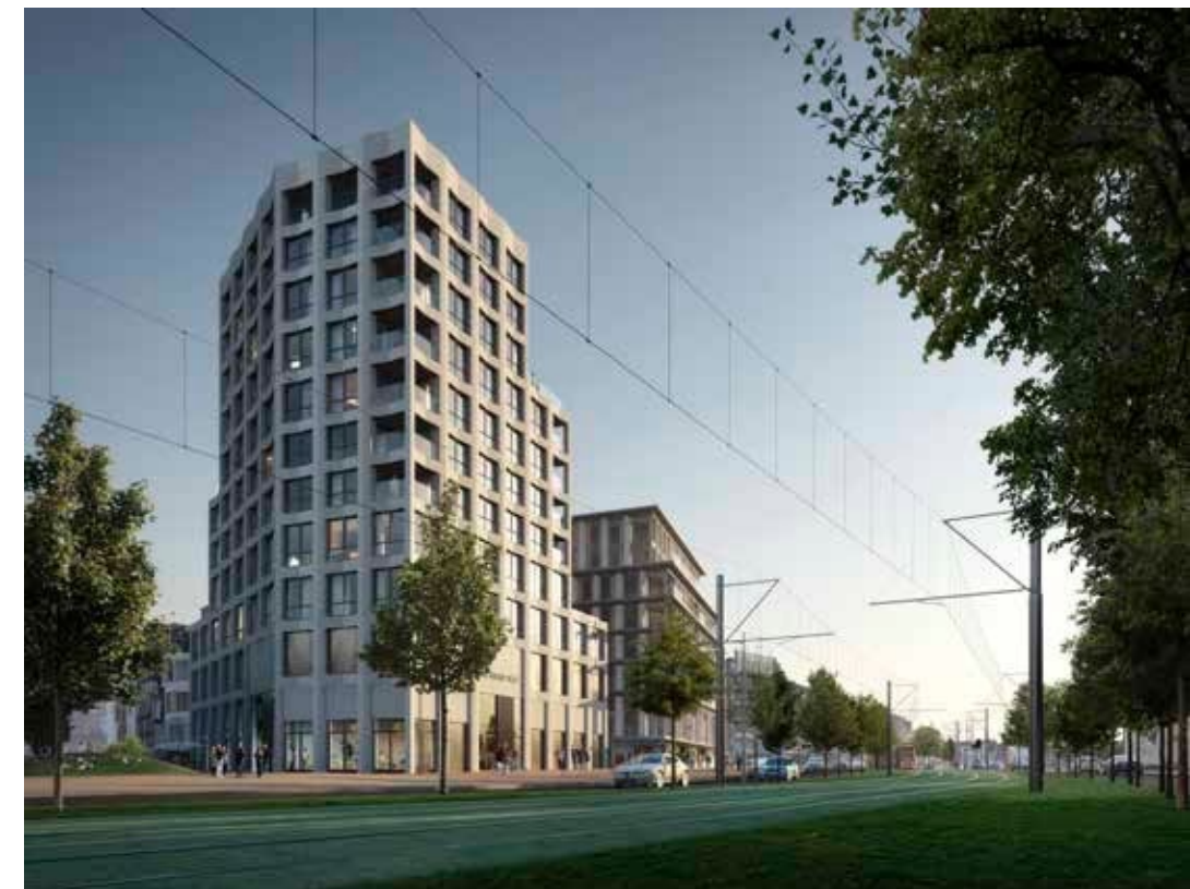
Aanzicht: De Hooghe Delft vanaf de Ireneboulevard

De nieuwbouw voor Lumen ligt in de zuidoosthoek van het noordelijk deel van de Spoorzone, op het kruispunt van de Ireneboulevard, de belangrijkste verkeersader die het centrum verbindt met de zuidelijke woonwijken, en het Van Leeuwenhoekpark, dat aangelegd wordt op de spoortunnel.