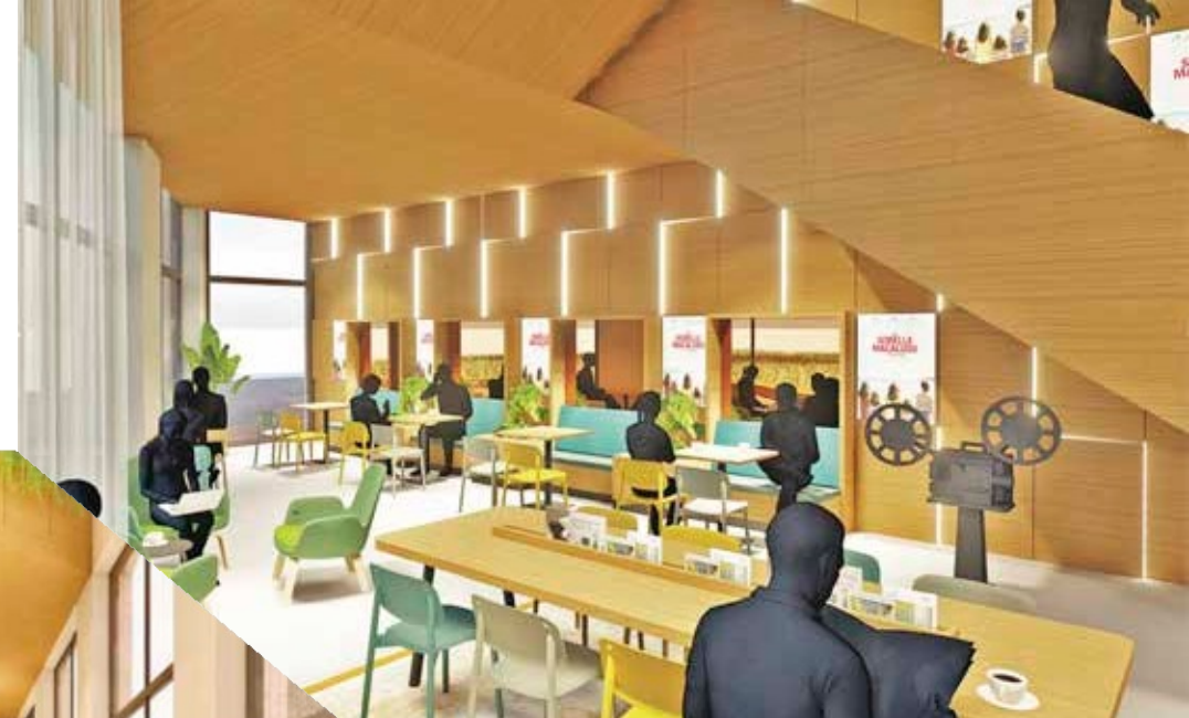
Foyer beneden kijkend naar bar en ingang parkzijde