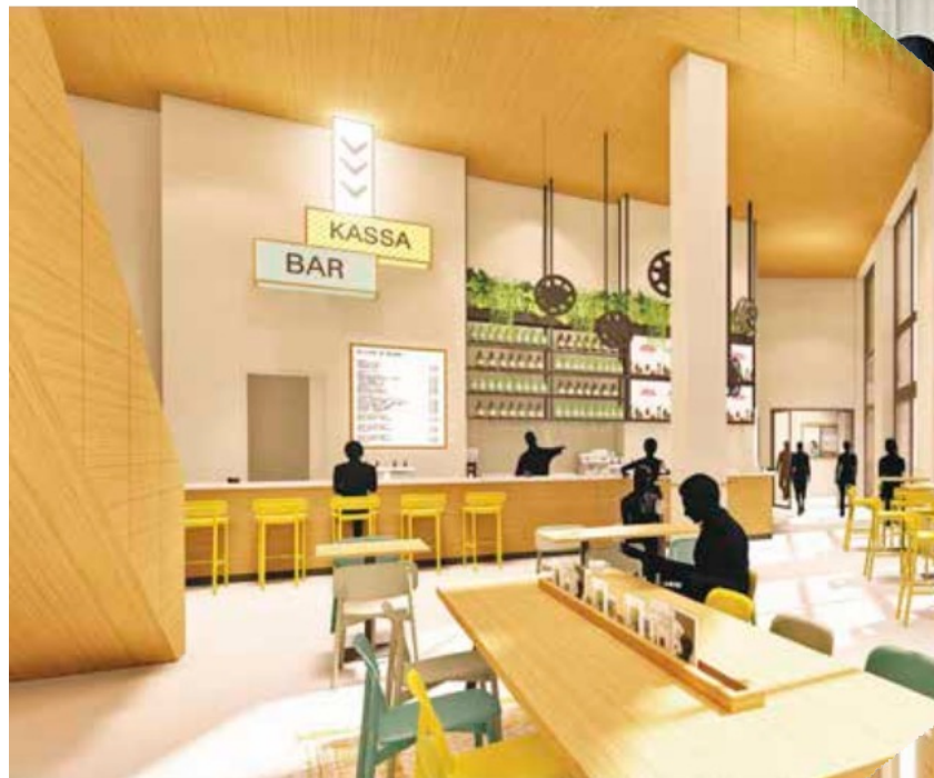
Foyer tussenver- dieping kijkend naar eerste verdieping